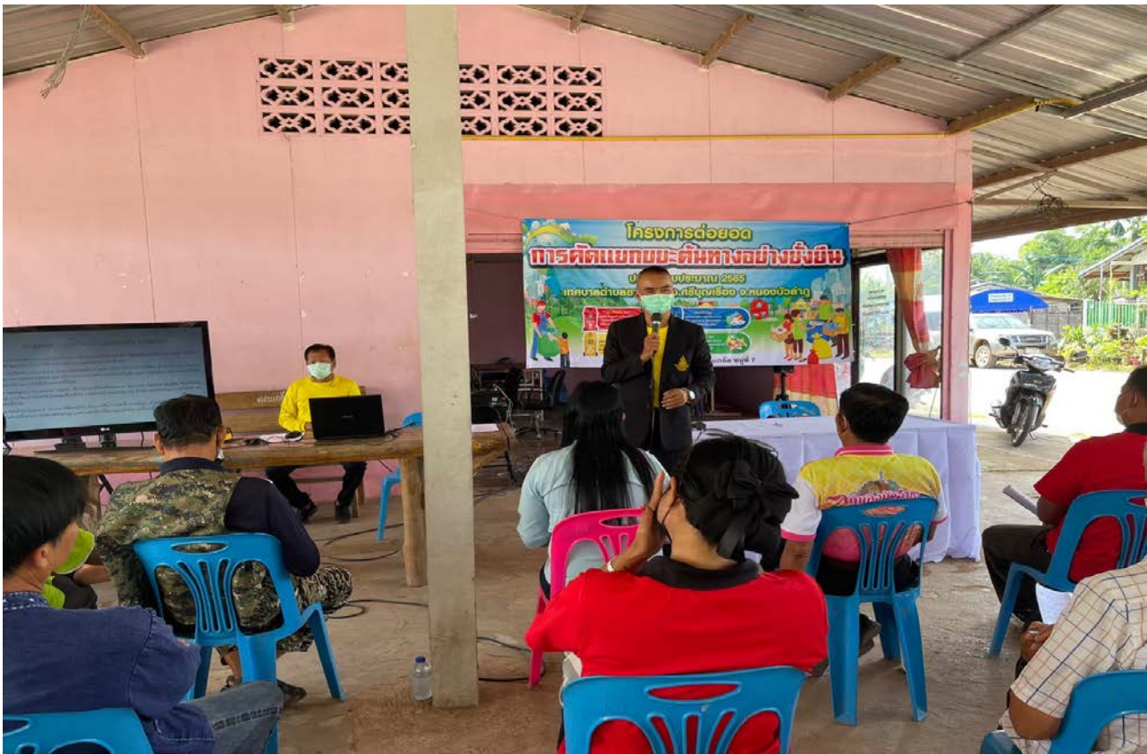
ทำขยะเปียก